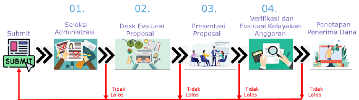
Gambar 2. Alur Mekanisme Seleksi Program Dana Padanan Tahun 2024

Mekanisme seleksi dilaksanakan untuk mendapatkan proposal terbaik sesuai dengan kriteria evaluasi yang ditetapkan dalam panduan ini. Mekanisme seleksi mencakup evaluasi kelengkapan administrasi proposal, kelayakan substansi proposal, serta kelayakan dan kewajaran usulan anggaran. Mekanisme dilaksanakan secara bertahap seperti pada Gambar 2 berikut.